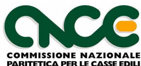
TABELLA CODIFICHE APPRENDISTATO V3 (22/05/2019) CCNL INDUSTRIA E COOPERAZIONE (accordo 4 aprile 2019)

Con la presente tabella sono fornite le nuove codifiche applicabili ai profili introdotti dall'accordo industria e cooperazione del 4 aprile 2019. A tale accordo deve essere fatto riferimento per quanto non indicato dalla presente tabella. Le vecchie codifiche saranno applicate fino al termine di ultimazione dei rapporti di lavoro precedentemente sottoscritti.